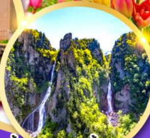
น้ำตกกิ่งกะ-น้ำตกริวเซ