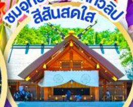
ชมอุทยานดอกทิวลิป สีสันสดใส