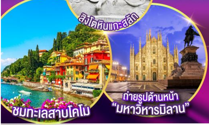
ชมทะเลสาบโคโม