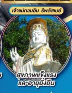
สุขภาพแข็งแรง และอายุยืนยาว