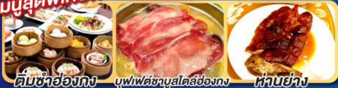
ติ่มซำฮ่องกง