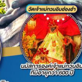
นมัสการองค์เจ้าแม่กวนอิม ที่มีอายุกว่า 600 ปี