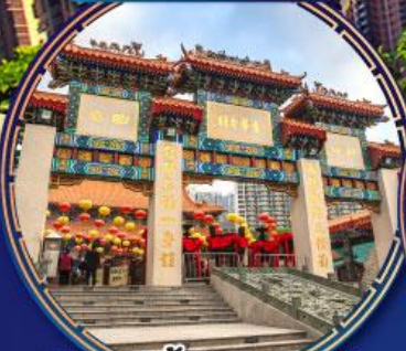
ขอพรด้านสุขภาพ