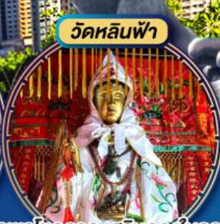
ขอพรโชคลาภ เสริมดวงในธุรกิจ การค้าขายและการเงิน