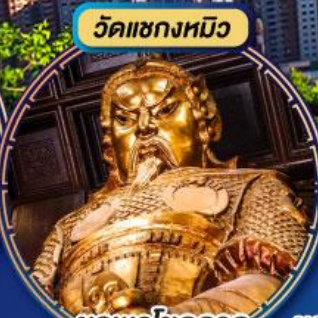
ขอพรโชคลาภ การเงินและธุรกิจ