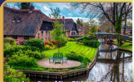
ล่องเรือหมู่บ้านไรทอนทีธูร์น