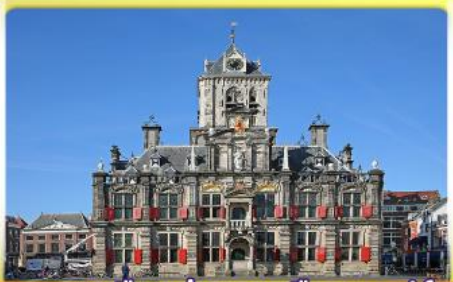
อาคารเมืองเก่าคลองเมืองเคลฟท์