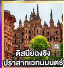
คิสนีย์จางซิง ปราสาทเวทมนตร์