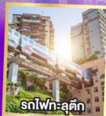
รถไฟฟ้า-สุตึก

เที่ยวเต็มอิ่ม..ไม่ลงร้านช้อปปิ้ง นั่งรถไฟความเร็วสูง 2 เที่ยว ไม่มีออฟชั่นเพิ่ม