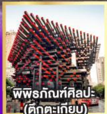
พิพิธภัณฑ์ศิลปะ- (ตึกตะเกียบ)