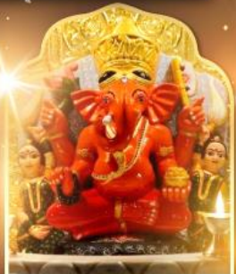
องค์สิทธีวินายก