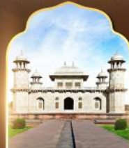
ทัชมาฮาลน้อย