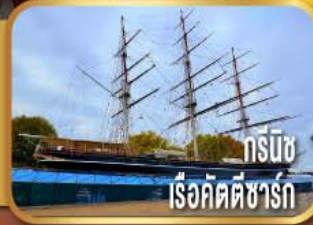
กรีนวิช เรือคัตตีซาร์ก