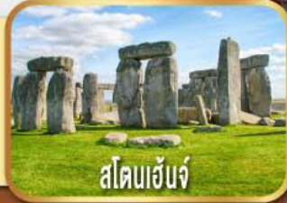
สโตนเฮ็นจ์