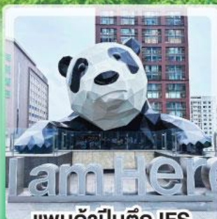
แพนด้าป็นตึก IFS