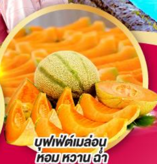
บุฟเฟ่ต์เมล่อน หอมหวานซ่า