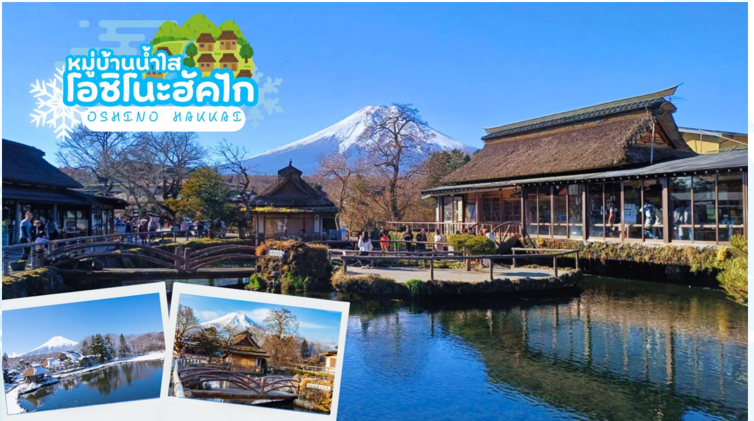
กลางวัน รับประทานอาหารกลางวัน ณ ร้านอาหาร (มื้อที่ 4)