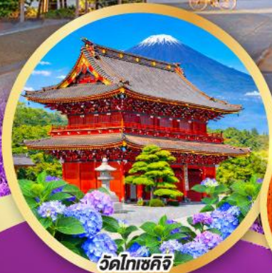
วัดโทเซคิจิ