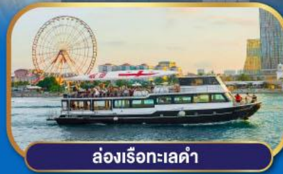
ล่องเรือทะเลดำ