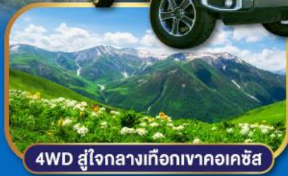
4WD สู่ใจกลางเทือกเขาคอเคซัส