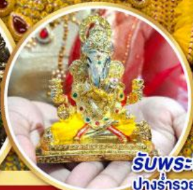
รับพระพิฆเนศวร ปางรำรอย ท่านละ ๑ องค์