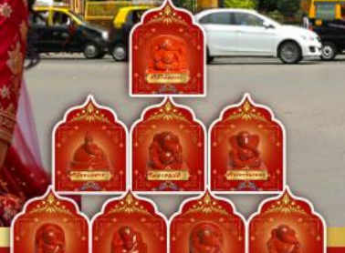
พระพิฆเนศ 8 องค์ เมืองปูणे