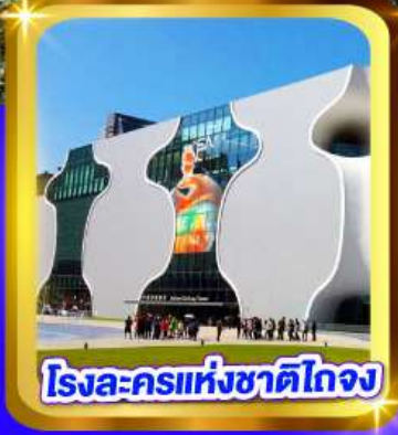
โรงละครแห่งชาติไทจง