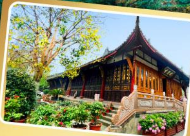
วัดต้าเจี๋ย