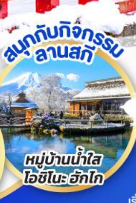
สนุกกับกิจกรรม ลานสกี