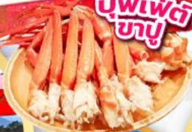
บุฟเฟ่ต์ ขาปู