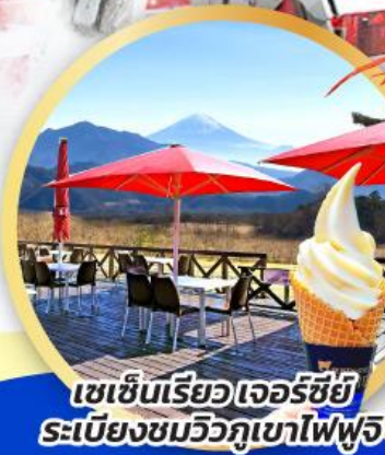
เซเชนเรียวเจอร์ชีย์ ระเบียงชมวิวกุเบไฟฟูจิ