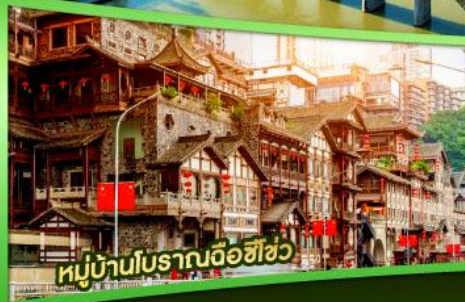
หมู่บ้านโบราณฉือซิว