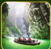
ล่องเรือแม่น้ำไตคินกุฮัว