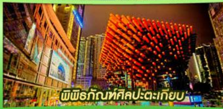
พิพิธภัณฑ์ศิลปะตะเกียบ