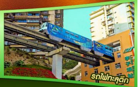
รถไฟฟ้าลัดคิว