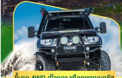
ขึ้นรถ 4WD สู่ใจกลางเทือกเขาคอเคซัส