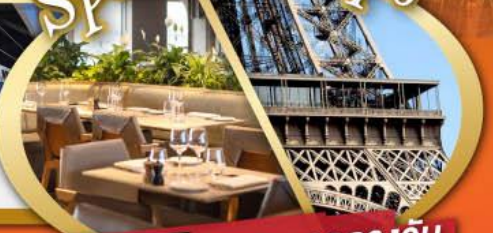
รับประทานอาหารกลางวัน บนหอไอเฟล

ไฮไลท์ในโปรแกรม • สะพานไม้ชาเปล ลูเซิร์น