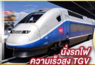
นั่งรถไฟ ความเร็วสูง TGV