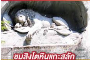
ชมสิงโตหินแกะสลัก