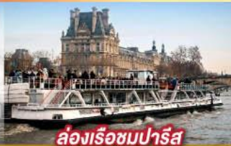
ล่องเรือชมปารีส