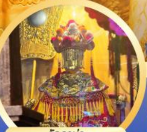
วัดอามา ขอพรเรื่องความปลอดภัยในการเดินทาง