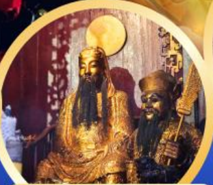
ขอพรเทพเจ้ากวนอู เสริมอำนาจบารมี ความซื่อสัตย์จัดคบคนเป็นสิ่งที่