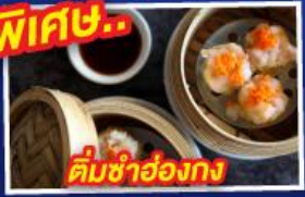
ต้มซ่าอ่องกง