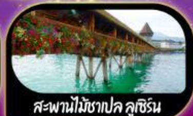
สะพานไม้ชาเปล ลูซีร์น