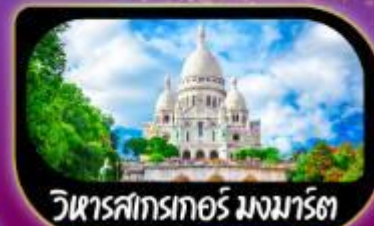
วิหารสกรทอร์ มงมาร์ต