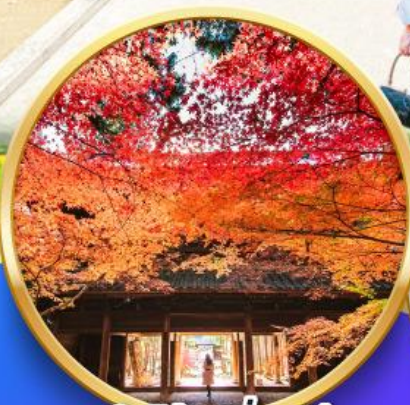
ชมใบไม้เปลี่ยนสี วัดโซเก็นจิ

นั่งกระเช้า ชมใบไม้เปลี่ยนสีภูเขาไดเซ็น ฟูจิ แห่ง ทตโตริ