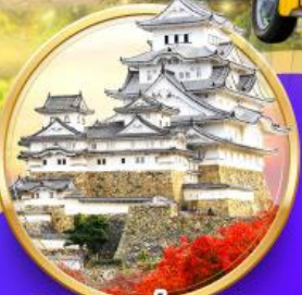
ชมใบไม้เปลี่ยนสี ปราสาทอิเมจิ