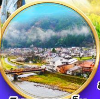
มิซาสะออนเซ็น