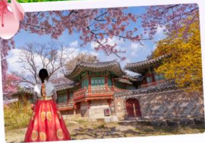
พระราชวังชางด็อกกุง