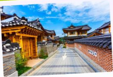
หมู่บ้านโบราณอินพยอง