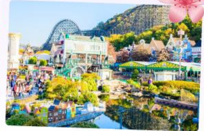
เอเวอร์แลนด์