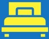
ห้องพักเดี่ยว SINGLE

ตัวอย่างประเภทห้องพัก *เป็นเพียงตัวอย่างเพื่อให้เห็นภาพสำหรับประเภทห้องในแบบต่างๆ