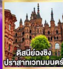
ดิสเนย์ฉงชิ่ง ปราสาทเวทมนตร์