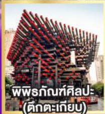
พิพิธภัณฑ์ศิลปะ (ตักตะเกียบ)