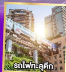
รถไฟทะลุติ๊ก