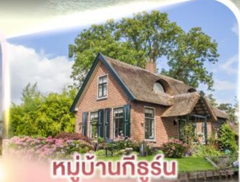
หมู่บ้านกีร์รูน