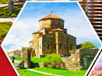
วิหารกอวารี