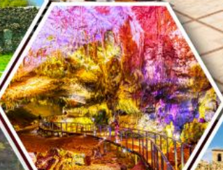
น้ำไพรบิชอุส