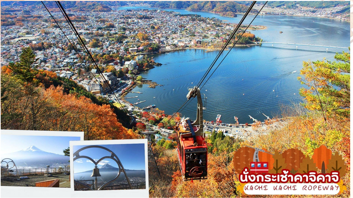
นั่งกระเช้าคาริคาจิ KACHIKI KACHIKI ROPEWAY