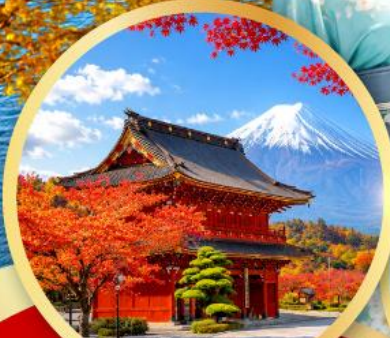
ชมประตูโทเซกจิแชนมอน วัดโทเซกจิ