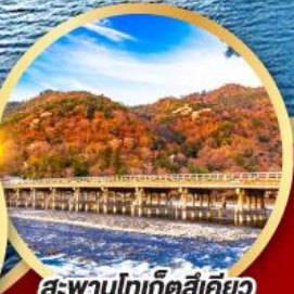
สะพานโทเก็ตสึเคียว