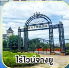
ไรไวน์จางยู