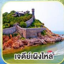
เจดีย์เฝิงไหล