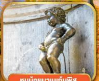
ทูน้อยมานเทินพิส