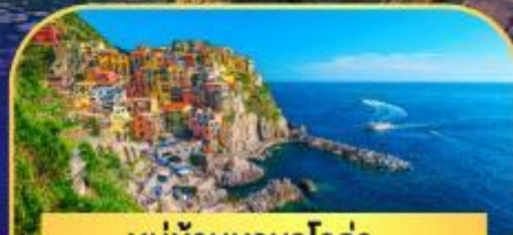
หมู่บ้านมานาโรล่า