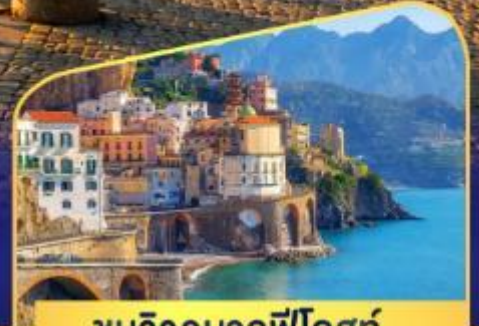
ชมวิวมอลฟีโคสก์