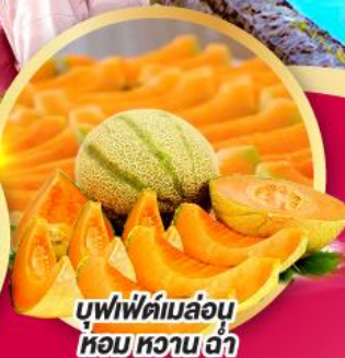
บุฟเฟ่ต์เมล่อน หอมหวานซ่า