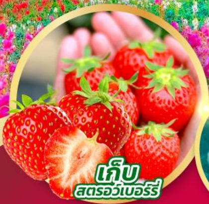
เก็บ สตรอว์เบอร์รี่