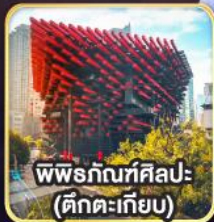
พิพิธภัณฑ์ศิลปะ- (ตึกตะเกียบ)