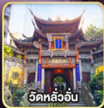
วัดหลัวอัน