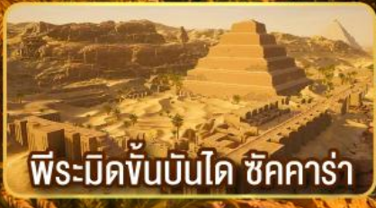
พีระมิดขั้นบันได ชิคคาร์่า