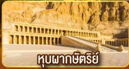
หุบผากษัตริย์