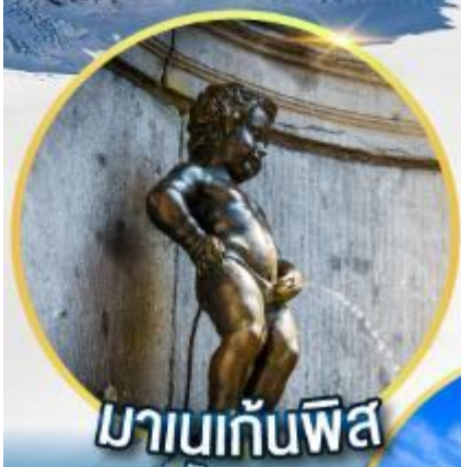
มานกันพิส