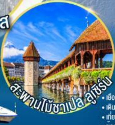
สะพานไม้ชาเปล ลูเซิร์น