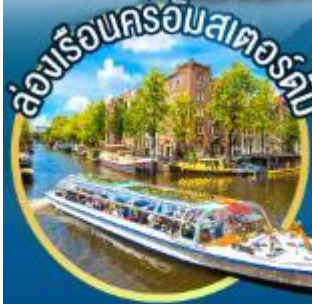
ล่องเรือนครอัมสเตอร์ดัม