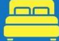
ห้องพักดับเบิล DOUBLE