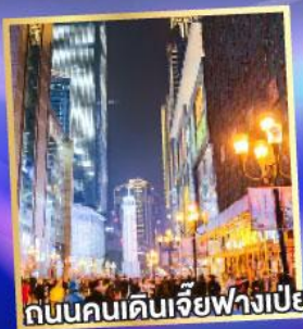
ถนนคนเดินเจียฟางเป่ย์