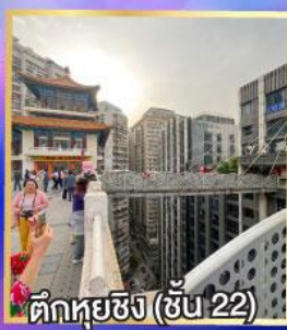
ตึกหุ่ยซิง (ชั้น 22)