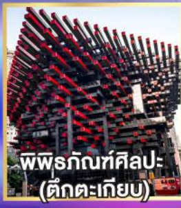
พิพิธภัณฑ์ศิลปะ (ตึกตะเกียบ)