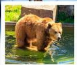
บ่อหมีเมืองเบิร์น