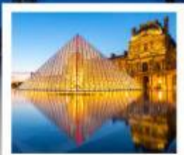
ถ่ายรูปปิพีร์กันที่ลูฟร์