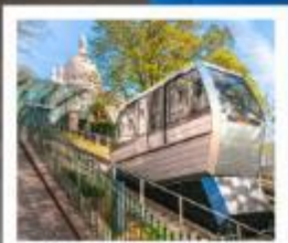
ขึ้นรางสู่มงมาร์ต