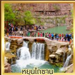
หยุ่นโกซ่าน