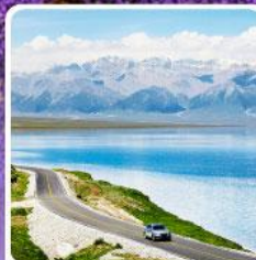
ทะเลสาบไซไห่หลี่มู่