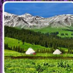
ทุ่งหญ้านาลาติ