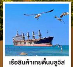
เรือสินค้าเกย์ตันบลูวิส