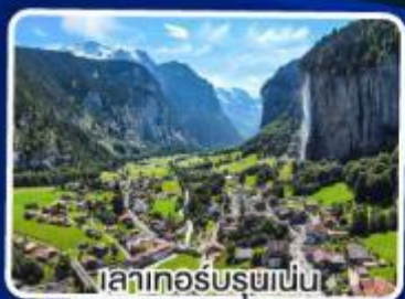
ลาเกอร์บรูค