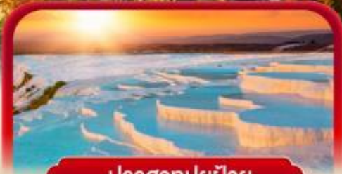
ปราสาทปูยฝ้าย