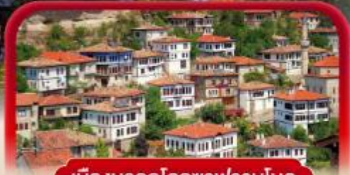
เมืองมรดกโลกซาฟรานโบลู