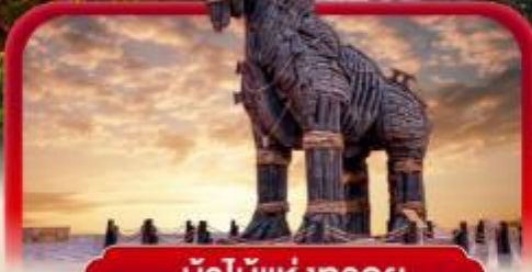
ม้าไม้แห่งทรอย