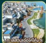
ทะเลสาบเอ๋อไห่คัง S