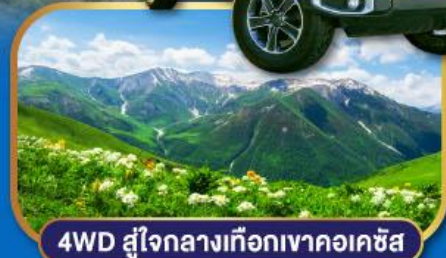
4WD สู่ใจกลางเทือกเขาคอเคซัส