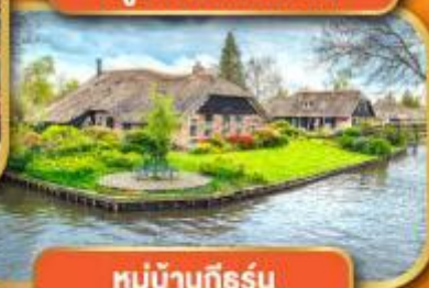
หมู่บ้านก็ธูร์น