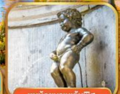
ทูน้อยมานเทินพิส