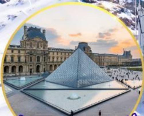
ถ่ายรูปพิพิธภัณฑ์ลูฟร์ GO3CDG-EK056