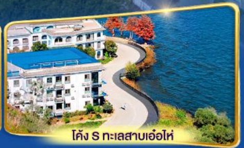
โค้ง S ทะเลสาบเอ่อไห่