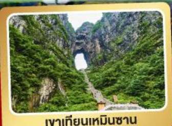
เขาเทียนเหมินซาน