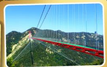
สะพานแขวนอ้ายจ้าย