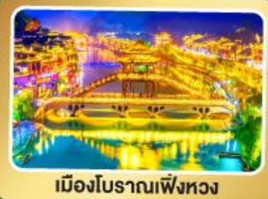
เมืองโบราณเฟิงหวง