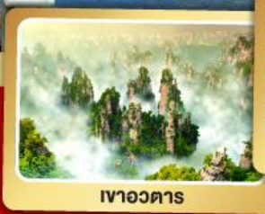
เขาอวตาร