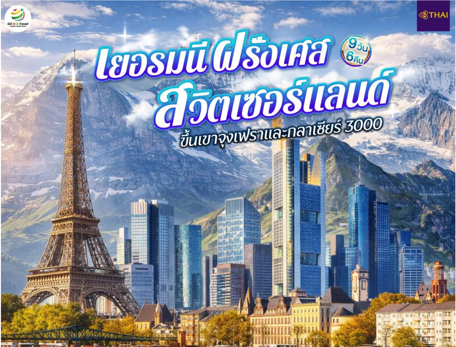
ยอดเขากลาเซียร์ 3000